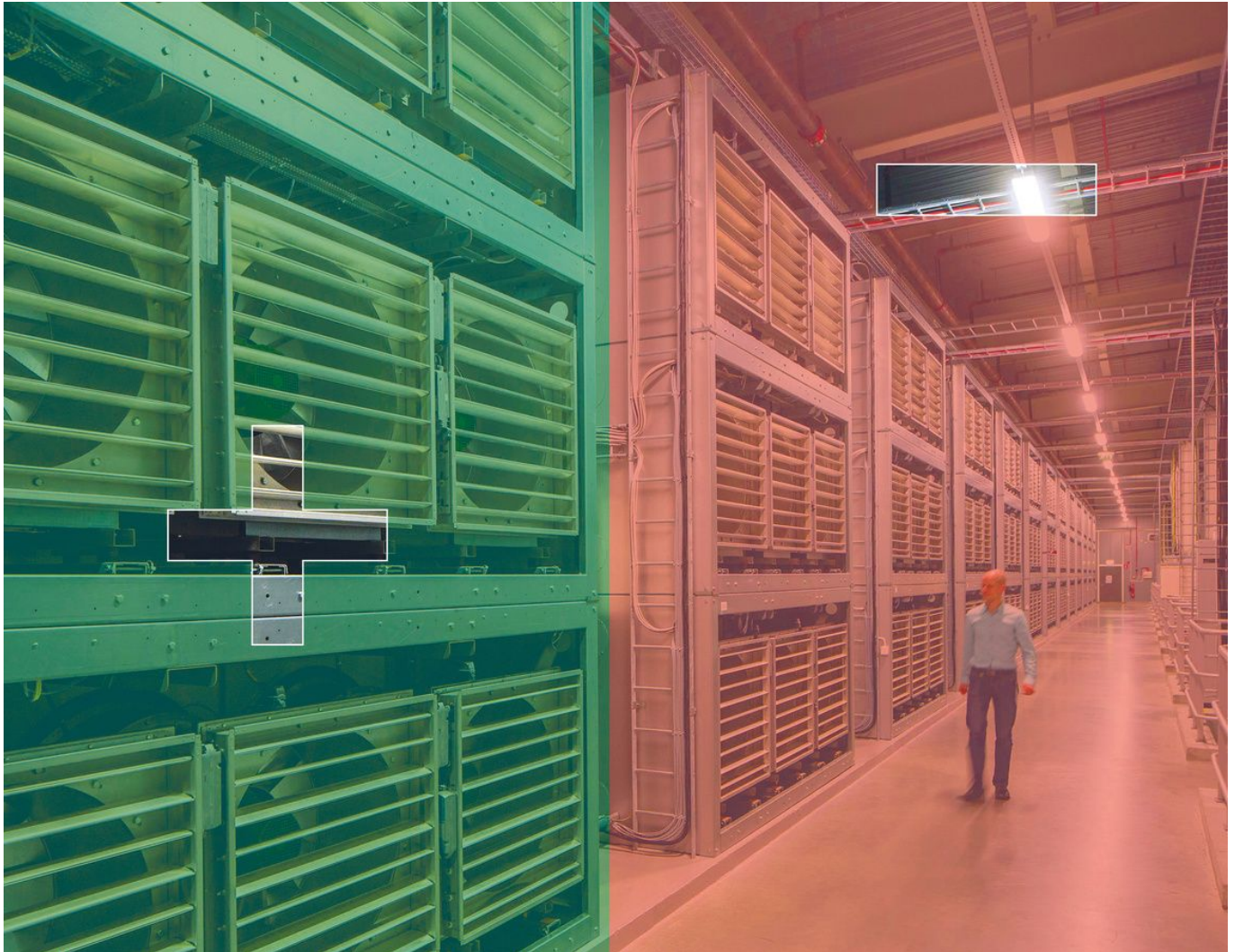
In Serverzentren wie dieser Halle im nordschwedischen Luleå speichert Facebook die Daten seiner rund 2,7 Milliarden Nutzer weltweit.

Nutzer aus je zwei verschiedenen EU-Ländern zusammengebracht, die dann live übersetzt chatten können. "Es ist anstrengend, man muss aus seiner Komfortzone heraus", sagt Klamroth. Aber es ist gefragt. Eva Wolfangel